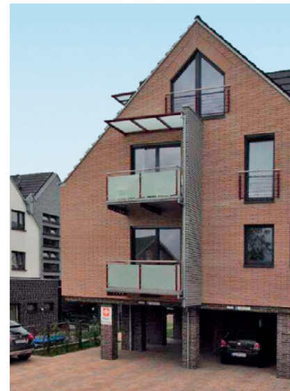
Bild: Eingang der Caritas Pflegeberatung Altenberge und des Büros Altenberge