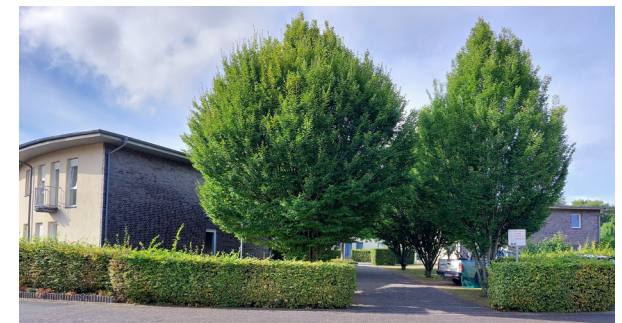
Caritas Pflegeberatung Laer