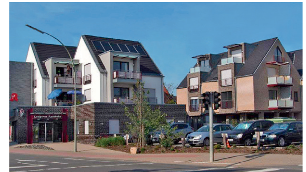
Caritas Pflegeberatung Altenberge